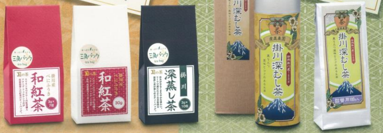
和紅茶ティーバッグ 和紅茶リーフ 深蒸し茶ティーバッグ 深蒸し茶 筒入り 深蒸し茶 詰め替え用

このお茶の魅力は風味豊かで、健康効果が期待できる有効成分を多く摂ることができるところです。長寿のお茶と言われており、誰にでも飲みやすく、健康的なお茶です。自然の恵みを受けた良質な茶葉を丁寧に仕上げました。